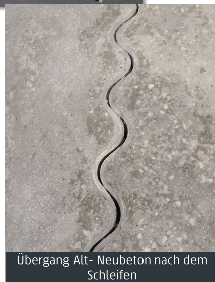
Übergang Alt- Neubeton nach dem Schleifen